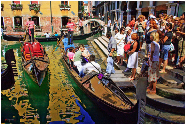
Bến khách ở Venedig

Nếu ít thì giờ, ta có thể đến từ sáng sớm mua vé du lịch bằng thuyền lớn, đánh một vòng trên các vùng chính của thành phố mất độ 3-4 tiếng đồng hồ. Ta được xem nhà cửa dinh thự với kiến trúc thời Trung cổ và thời đại Phục hưng rất hấp dẫn. Nhưng như thế ta mất đi một tuyệt thú được lên đênh trên sóng nước êm đềm, chầm rãi thả trôi để quên đi ngày tháng nhọc nhằn qua tiếng hát trầm