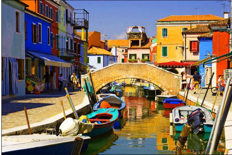
Một khu của Burano

con người tạo ra. Đến Venice ta có thể đi thăm những thánh đường cổ xưa như thánh đường Santa Maria della Salute xây cất từ năm 1631 đến 1687, xem cầu danh tiếng Rialto, ghé nhà của Marco Polo, người tạo ra con đường lụa là v. v. . .